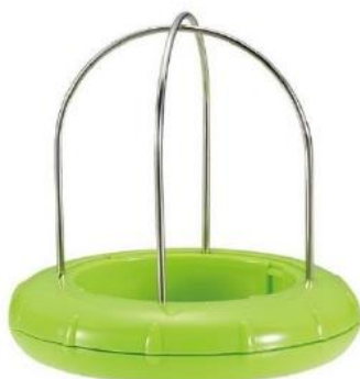
キウイカッター本体 付属品：収納式のナイフ