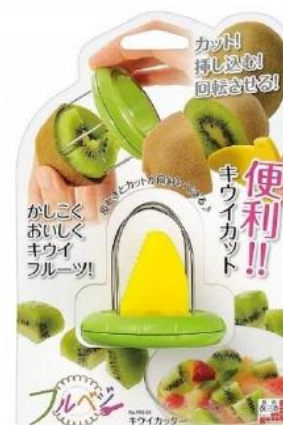
パッケージ のイメージ